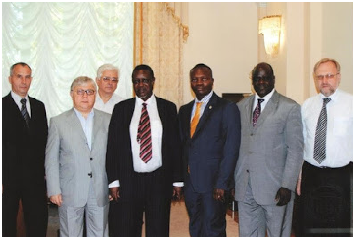
Фото 11. Візит делегації уряду Кенії до ОНУ імені І. І. Мечникова (2012 р.)

Пошук нових перспективних партнерів не обмежується Європою, а і стосується Південного Сходу, країн Африканського континенту (див. фото 11).