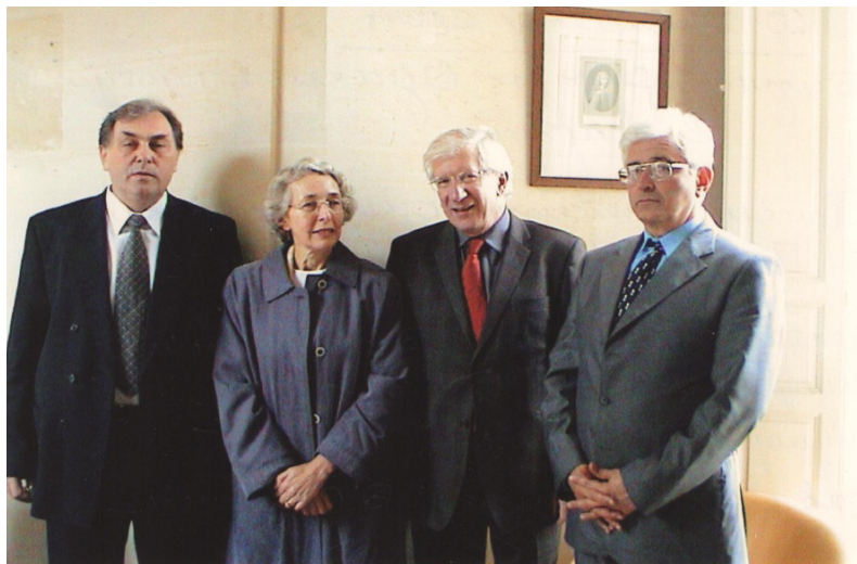
Фото 2. Презентація унiверситету в Парижі (Сорбона, 2004)

кова підписали двосторонній договір про науково-освітнє спiвробiтництво з унiверситетом Париж-1 (Сорбона), (див. фото 2).