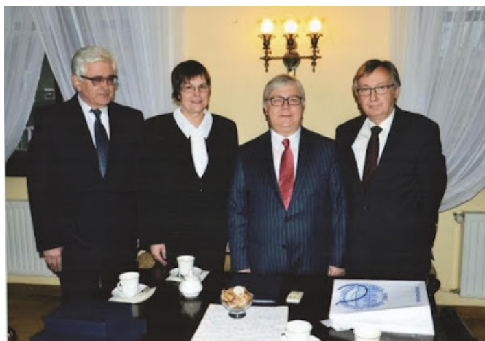
Фото 4. Урочистості в Ягеллонському університеті (2013 р.)

Дуже важливою подією у стосунках з ВНЗ Польщі стало підписання Меморандуму про взаєморозуміння з одним із найстаріших університетів Європи – Ягеллонським університетом в Кракові, для чого у грудні 2013 року наш університет був запрошений Генеральним Консульством Польщі в Одесі (див. фото 4).