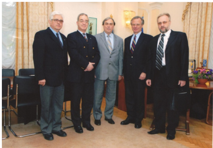
Фото 8. Семінар Європейської Асоціації Університетів «Болонський процес та питання його імплементації» (2008 р.)