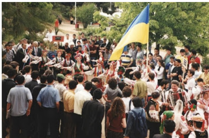
Фото 5. Ансамбль Університету в м. Трабзон (Туреччина, 2000 р.). Місія дружби і гуманізму