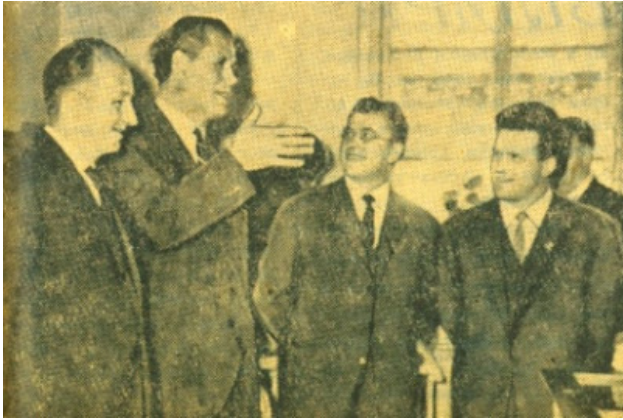
Фото 1. Ректор ОДУ імені І. І. Мечникова професор О. І. ЮРЖЕНКО дає пояснення іноземним гостям

У наступні часи ці контакти переросли в повномасштабні двосторонні відносини.