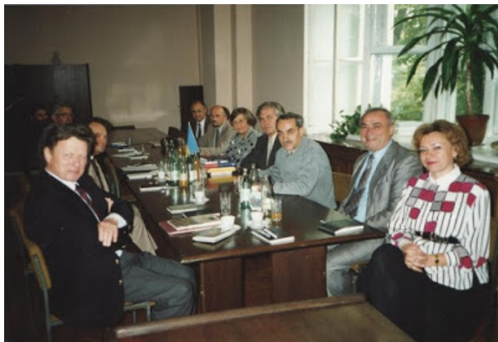
Фото 6. Зустрічі в Одеському університеті з делегацією Регенсбурзького університету (1992 р.)