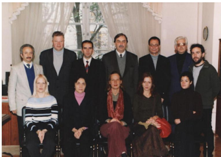
Фото 1. Зустріч іноземних викладачів з ректором ОНУ імені І. І. Мечникова (2002 р.)

В нашому університеті з'явилася така форма освітянського співробітництва як запрошення іноземних викладачів-носіїв своєї мови для викладання на факультетах романо-германської філології, філологічному, в Інституті соціальних наук.