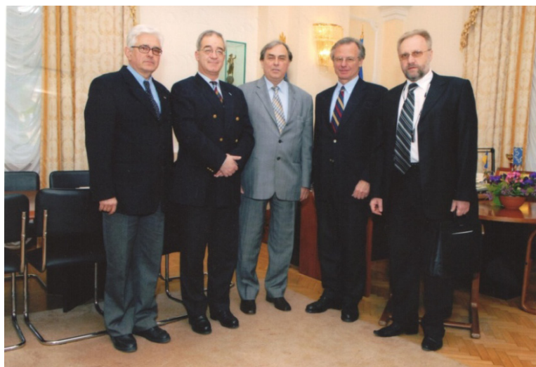
Photo 9. Seminar of European University Association «Bologna Process results implementation» (2008)