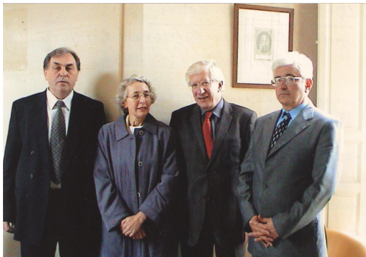
Photo 2. The Odessa University presentation in Paris (Sorbonne, 2004)