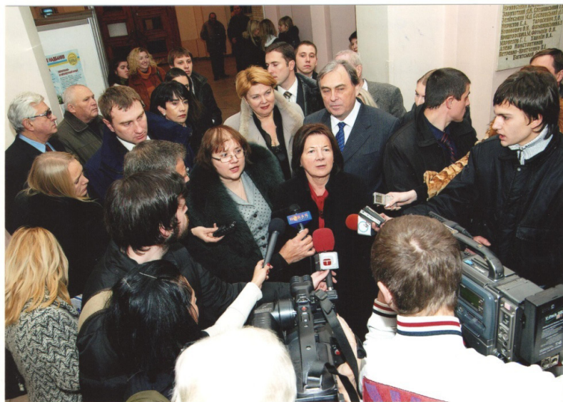
Фото 3. Візит пані Марії КАЧИНЬСЬКОЇ до ОНУ імені І. І. Мечникова (2007 р.)

У 2007 р. дружина Президента Польщі пані Марія КАЧИНЬСЬКА відвідала ОНУ імені І. І. Мечникова з ознайомчим візитом (див. фото 3).