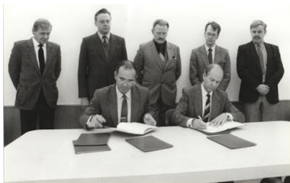
Фото 4. Момент підписання двосторонньої угоди з Оульським університетом