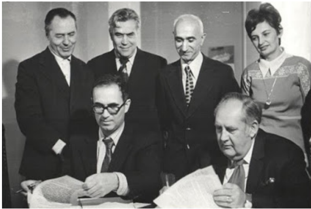
Photo 3. The Agreement signing episode

Bilateral agreements were concluded with The University of Szeged (Hungary) and The Oulu University (Finland), (see photo 3, 4).