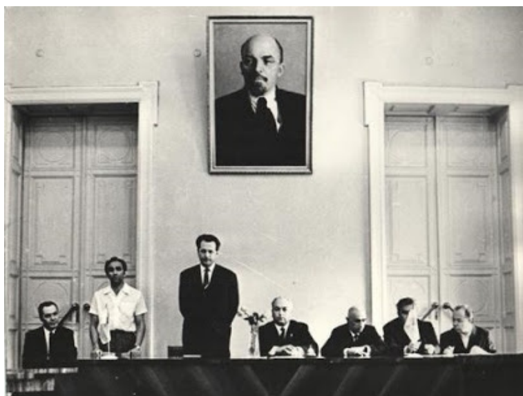
Photo 2. The ceremonial sitting of the OSU Scientific Council