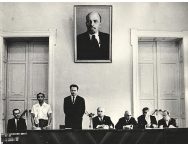
Фото 2. Момент урочистого засідання вченої ради ОДУ імені І. І. Мечникова за участю іноземного гостя

плідних наукових міжнародних контактів і сам особисто приймав участь у міжнародних заходах (див. фото 2).