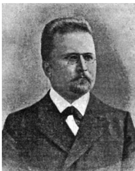
Фото 1. Професор П. Є. Казанський

адміністративні організації. Результатом чималої роботи у цьому напрямку стала докторська дисертація «Загальні адміністративні союзи держав» у 3-х томах. Ці роботи заклали міцний фундамент для подальших наукових розробок у сфері міжнародного права, яке в той період переживало саме етап свого становлення як нової самостійної дисципліни.